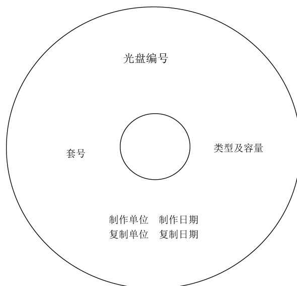
图 C.1 光盘盘面式样